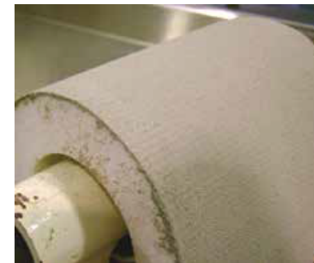
Prueba de Resistencia a la Flexión sin Agrietamiento